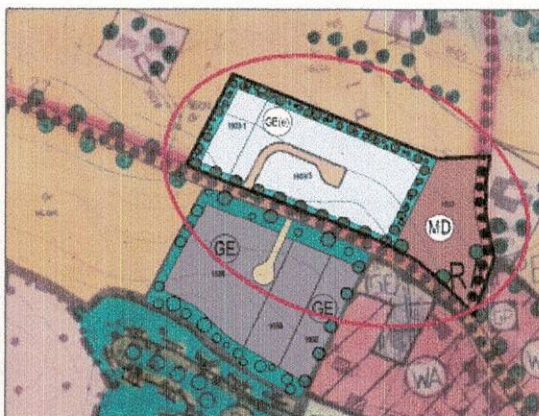
Änderung Landschaftsplan Dbl. Nr. 16